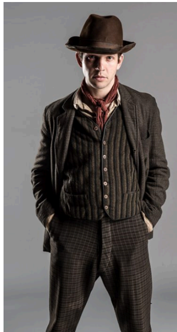
klobouk typu homburg